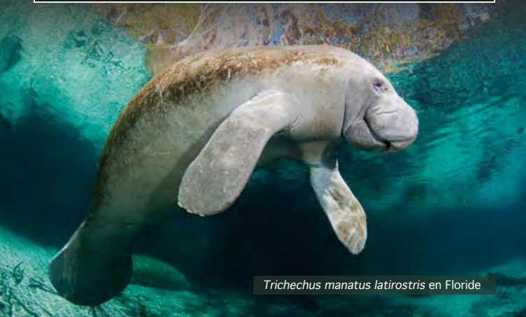
Trichechus manatus latirostris en Floride

Statut Liste Rouge UICN Espèce vulnérable