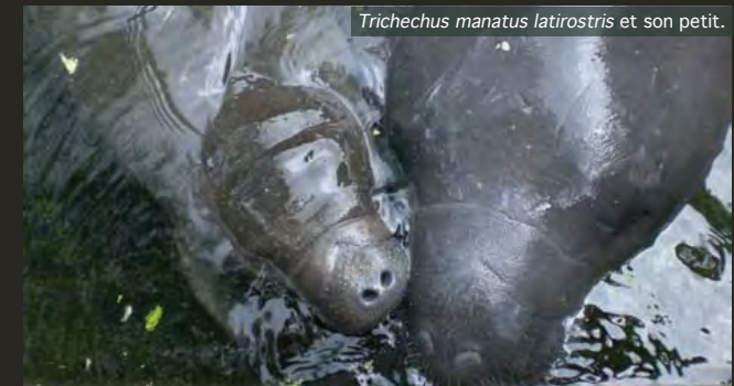
Trichechus manatus latirostris et son petit.

Bien que généralement solitaires, il est parfois possible d'observer des regroupements temporaires de plusieurs lamantins. Cependant, les interactions restent limitées, si ce ne sont les relations mère-enfant qui durent 1 à 2 ans, après une gestation de plus d'un an. Les naissances ont lieu tous les 2 à 4 ans, la durée de vie en captivité est de plus de 50 ans.