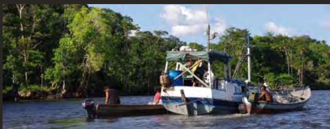
Les filets des pêcheurs : une menace importante pour la survie du lamantin.

En Guyane, les prises accidentelles dans les filets et le braconnage occasionnel pour la chair sont les principales menaces. Plus rarement, il est encore tué pour de prétendues vertues aphrodisiaques. D'autre part, le trafic maritime et la qualité de l'eau dans certaines zones (estuaire du Mahury, rivière de Cayenne, estuaire de Mana et rizières) pourraient limiter l'abondance du lamantin et affecter la qualité des ressources alimentaires.