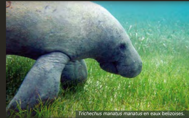
Trichechus manatus manatus en eaux belizoises.

Les nageoires du lamantin sont en fait des membres antérieurs adaptés à son mode de vie, utilisés pour porter la nourriture à la bouche, se gratter ou soutenir le corps lorsqu'il se nourrit. Herbivore assez opportuniste, le lamantin se nourrit de très nombreuses graines flottantes et plantes aquatiques qu'il brote au fond, en surface et sur les berges. Mais la faiblesse énergétique de ce régime alimentaire et une digestion peu efficace le contraignent à se nourrir 6 à 8 heures par jour : on le trouve par conséquent dans les zones où la nourriture est abondante.