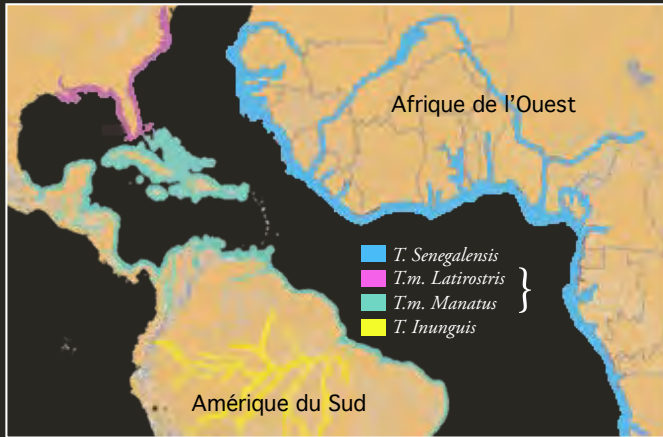
Aire de répartition des trois espèces de lamantins

Trois espèces sont présentes dans les zones Atlantique, Caraïbes et en Amazonie. L'aire de répartition de l'espèce trouvée en Guyane, Trichechus manatus , s'étend du Brésil à la Floride, avec deux sous-espèces reconnues.