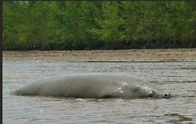
Les lamantins fréquentent les eaux saumâtres : milieux côtiers, estuaires de mangroves, marais, savanes inondées. Ici, estuaire guyanais.

Les populations de lamantins sont considérées menacées sur la façade Atlantique. En Guyane, le comportement placide, la discrétion du lamantin et le faible degré de perturbation des mangroves qu'il affectionne, laissent toutefois envisager des perspectives plus optimistes pour l'espèce dans la région.