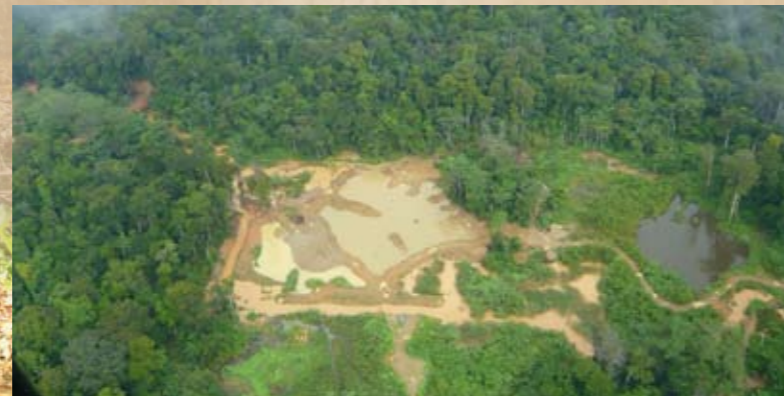
Forêt et cours d'eau durablement impactés par un site d'orpaillage.

Kwata réalise des inventaires de la faune et met en relation la richesse et l'abondance des espèces avec les différents niveaux de pression comme l'exploitation forestière, la chasse, le développement des infrastructures, la fragmentation des habitats. Ces travaux entendent mieux comprendre comment les espèces réagissent aux menaces, pour ainsi aider à mettre en place les mesures de préservation les plus efficaces. L'association apporte ainsi au quotidien son expertise sur les questions de gestion des ressources naturelles et d'aménagement du territoire.