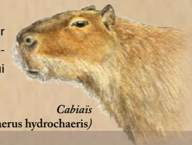
Cabiaïs (Hydrochaeris hydrochaeris)

Les Salines de Montjoly, constituent sur 63ha une zone exceptionnelle par la richesse des milieux et la biodiversité qui les composent.