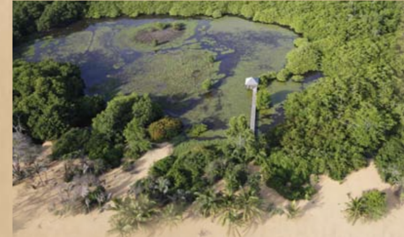
Au coeur de l'île de Cayenne, la mangrove et sa zone humide exceptionnelle, réservoir de biodiversité.

Depuis juin 2012 l'association Kwata est gestionnaire du site des Salines de Montjoly, propriété du Conservatoire du littoral. L'association a pour mission la mise en oeuvre et l'évaluation du Plan de gestion, le suivi scientifique du patrimoine naturel, le gardiennage et la surveillance du site, l'animation, la sensibilisation du public et la communication.