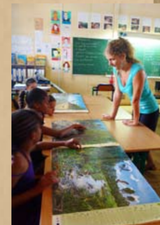
Animation en classe dans le cadre d'un projet pédagogique sur le lamantin.