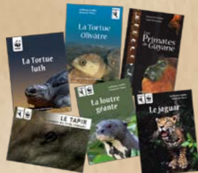
Quelques uns des ouvrages publiés par l'association Kwata