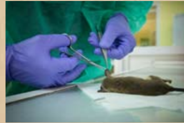
Prélèvement de tissus sur un Marmosa murina en vue d'analyse génétique.

Réalisé avec l'Institut Pasteur de la Guyane, il s'appuie sur : - Une collection de tissus animaux, permettant la conservation, la valorisation, la mise à disposition en Guyane et dans le monde de tissus animaux dédiés à la connaissance des espèces. - Des travaux sur la diversité des espèces amazoniennes, - La formation et l'accueil d'étudiants et chercheurs de la région pour travailler sur la génétique animale.