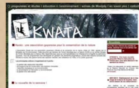
Plus d'informations sur notre site internet : www.kwata.net

En lien avec le programme de conservation des tortues marines, l'association accueille le public et les scolaires sur les plages de l'île de Cayenne tout au long de la saison de ponte, directement sur les plages.