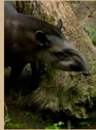
Le tapir (Tapirus terrestris) et le jaguar (Panthera onca), deux espèces emblématiques.

populations, télédétection...) et un axe de communication et de sensibilisation auprès du public.