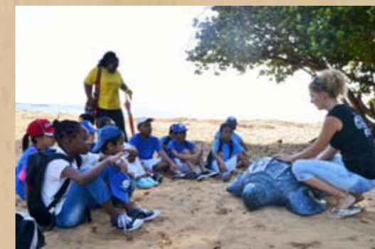
Animation tortues marines sur la plage de Cayenne avec des enfants d'un Institut Médico-Educatif