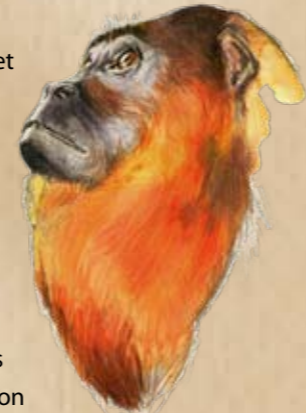
Le singe hurleur (Alouatta macconnelli) l'une des espèces qui subit le plus les pressions de chasse.