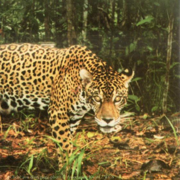
Cliché issu d'un piège photo © Association Kwata / WCS

Une densité proche de 3 individus pour 100 km 2 a été observée sur le premier site étudié, ce qui est comparable aux densités connues dans d'autres pays, en forêts non perturbées. D'autres zones en Guyane feront l'objet d'études.